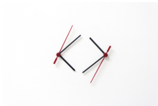
Manuel Casellas Abrir imagen ↓