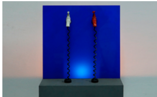
Luis Lugán Abrir imagen ↓