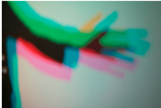
Waldo Balart Abrir imagen ↓