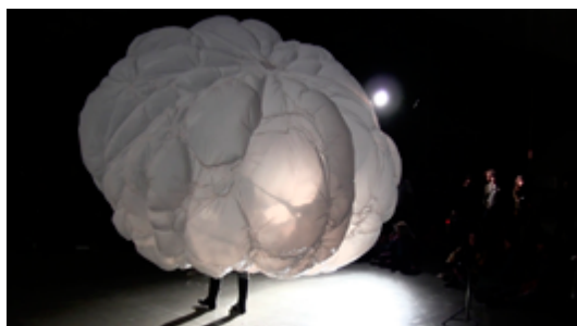
Olga Diego Abrir imagen ↓