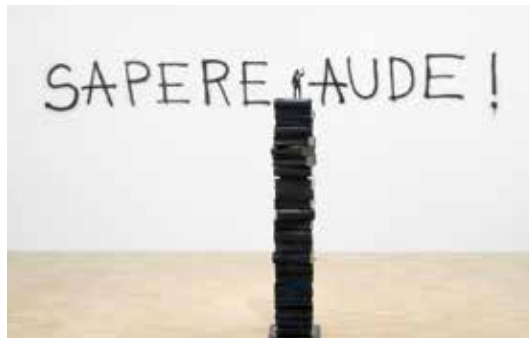
Avelino Sala Abrir imagen ↓