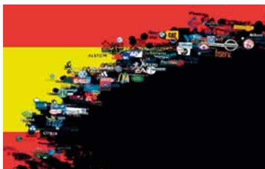
PSJM Abrir imagen ↓