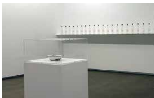
Luis Camnitzer Abrir imagen ↓