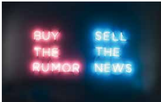
Asunción Molinos Gordo Abrir imagen ↓