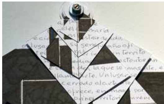
Isidoro Valcárcel Medina Abrir imagen ↓